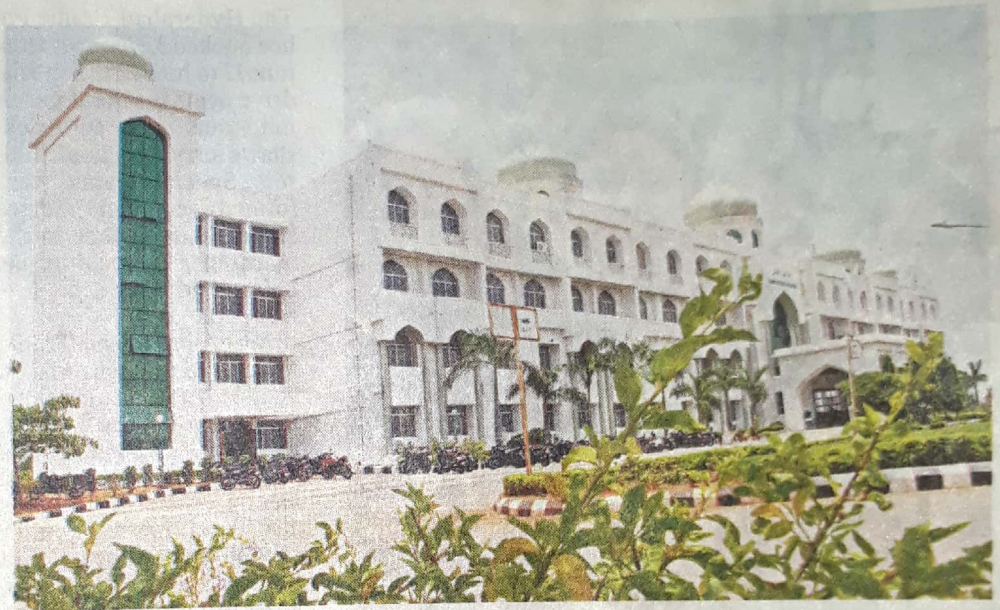
MANUU has become the first Central university in the country to bring in such a reform.

After checking the valued answer scripts, students can discuss with their teachers as to where they need improvement, what their strengths and weakness were, what steps should they take to enhance their learning and so on, the university said. The new system had been initiated to bring in